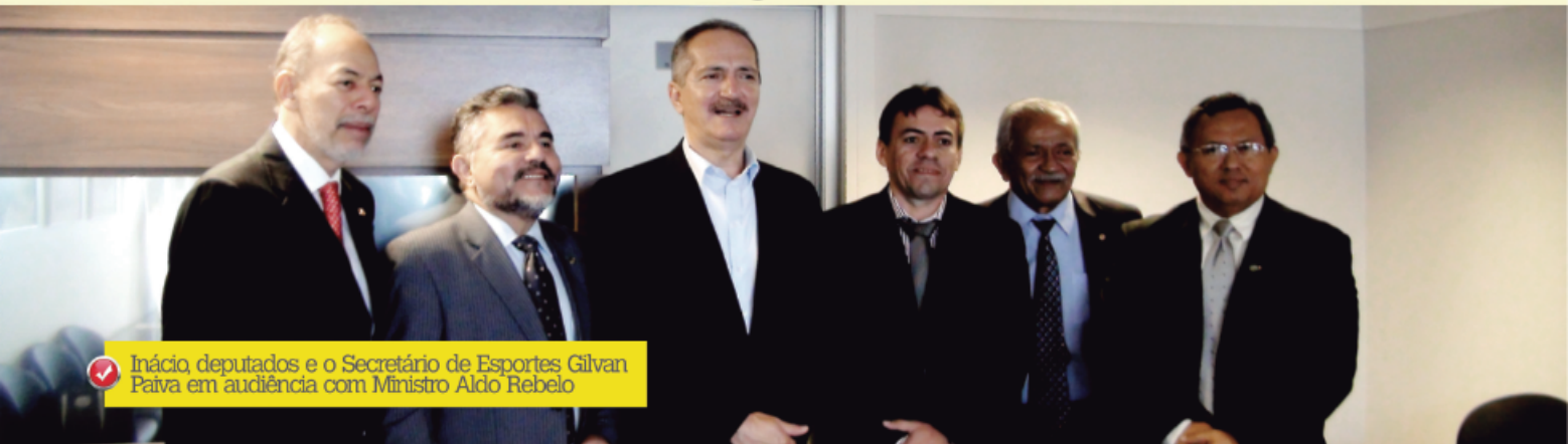
Inácio, deputados e o Secretário de Esportes Gilvan Paiva em audiência com Ministro Aldo Rebelo

Com o objetivo de ampliar a oferta de infraestrutura de equipamento público esportivo qualificado, incentivando a iniciação esportiva em territórios de alta vulnerabilidade social das grandes cidades brasileiras, o ministério do Esporte desenvolveu a concepção do Centro de Iniciação ao Esporte (CIE), integrando num só espaço atividades físicas e a prática de esporte de alto rendimento, estimulando a formação de atletas entre crianças e adolescentes.